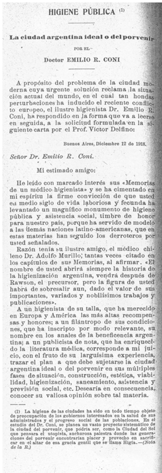
Figura 2. ARTÍCULO ORIGINAL DE EMILIO R. CONI, PUBLICADO EN LA SEMANA MÉDICA. AÑO 1919.