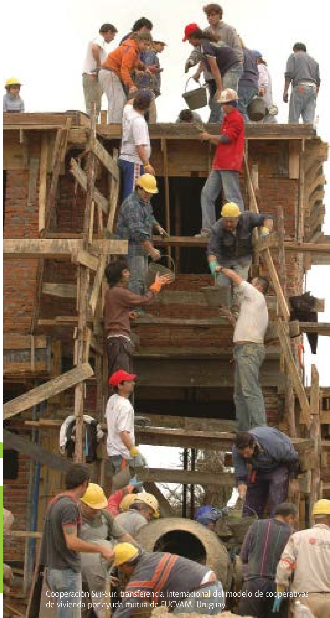
Cooperación Sur-Sur: transferencia internacional del modelo de cooperativas de vivienda por ayuda mutua de FUCVAM, Uruguay.