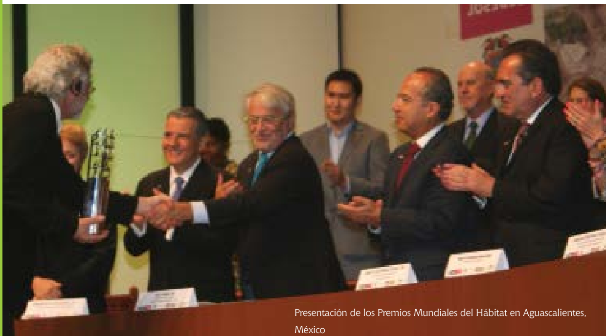
Presentación de los Premios Mundiales del Hábitat en Aguascalientes, México

Las prácticas ganadoras también reciben trofeos, y una beca para cubrir los gastos de viaje y alojamiento para un representante de cada proyecto ganador, para asistir a la ceremonia de premiación en el Día Mundial del Hábitat del Programa de las Naciones Unidas para los Asentamientos Humanos (ONU-Hábitat).